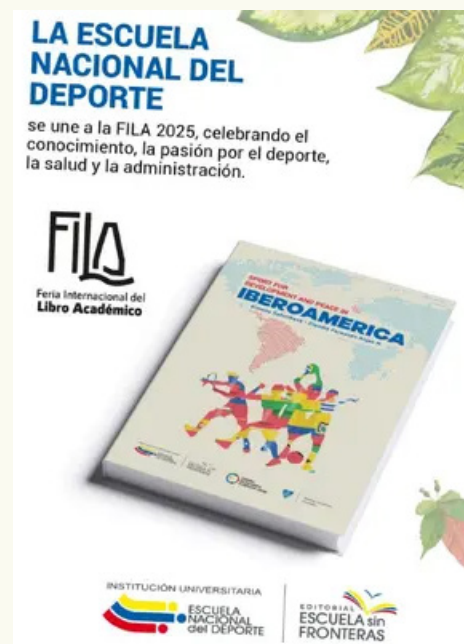
Libro internacional: Sport for Development and Peace in Iberoamerica , de las autoras Simona Šafaříková y Claudia Fernanda Rojas.

pismo y la proyección internacional, fortaleciendo su papel como un referente en el estudio del deporte para el desarrollo y la paz.